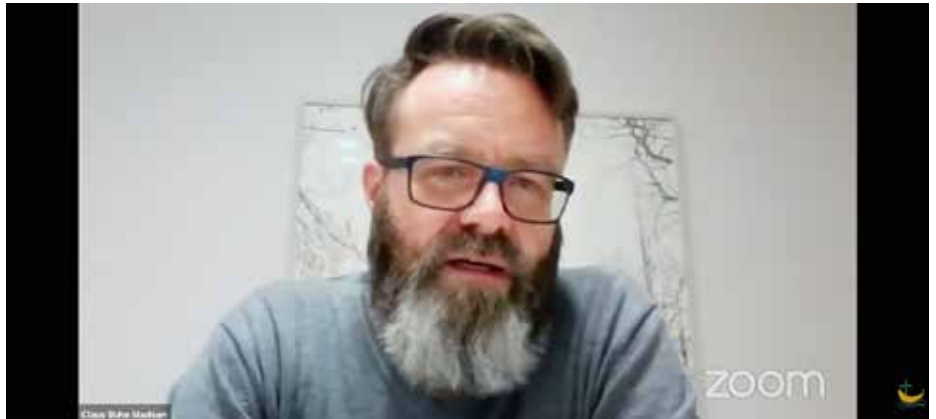
Auch der Rostocker Oberbürgermeister Claus Ruhe Madsen beteiligte sich an einem Meet Up der Don-Bosco-Schule.

Das eine große „Highlight“ lässt sich schwer festmachen. Begeistert hat sicher der