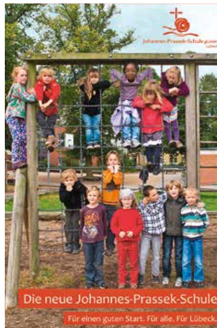
Die Johannes-Prassek-Schule plant für die Zukunft ein neues Schulgebäude.

Einen besonderen Impuls erhielt die Schule durch die Veränderung in der Trägerschaft. Heute ist die „Johannes-Prassek-Schule gemeinnützige GmbH“ der Träger. Gesellschafter der gGmbH sind weiterhin die Bernostiftung und hinzugetreten