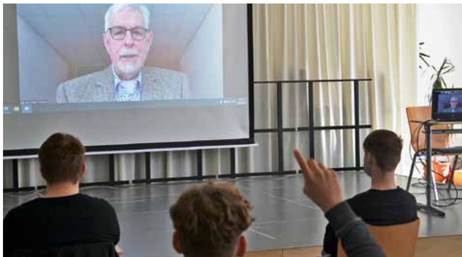
Berufsmesse online für die Absolventinnen und Absolventen der Mittleren Reife.

Die Siebtklässler*innen können sich auf ein neues Programm freuen: „Mission Ich“ wurde von der Uni Rostock entwickelt und umfasst drei Klassenstufen. Lehrkräfte und Schulsozialarbeiter*innen entdecken in dieser Zeit gemeinsam mit den Jugendlichen deren berufliche Potenziale und entwickeln Schlüsselkompetenzen für die Arbeitswelt.