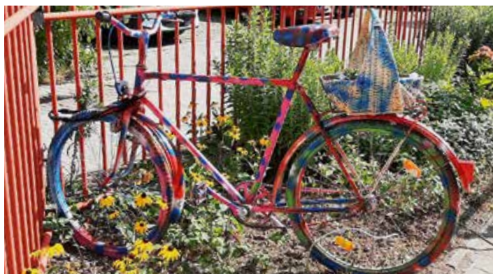
Viele leuchtende Kunstwerke sind auf dem Gelände der Don-Bosco-Schule entstanden, wie dieses bunte Fahrrad, das die Menschen am Eingang begrüßt

Gemeinsam mit einem Graffiti-Künstler entwarfen die Kinder ihr eigenes Graffiti. Nach Proben auf Papier ging es an die Gestaltung der großen Platten, die auf dem Schulhof Platz finden sollten. Außerdem wurde mit den Kindern ein altes Fahrrad besprüht. Dies steht nun zur Begrüßung am Eingangstor. Die bunten Platten, glänzende Baumscheiben und das Fahrrad leuchten nun in prächtigen Farben. Wer sich das ansieht strahlt; die Kinder sind stolz. „Lass es leuchten, innen und auch außen.“