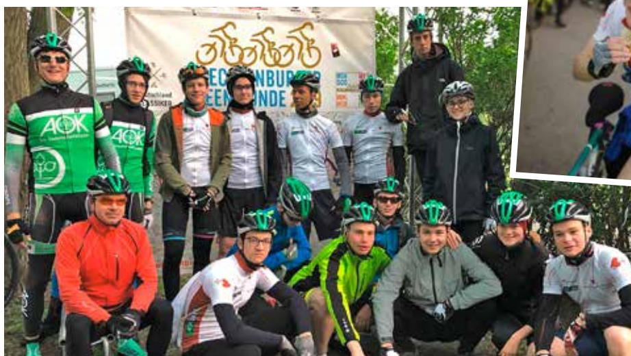
Gemeinsam haben Schülerinnen und Schüler erfolgreich einen Radmarathon bewältigt. Eine Fortsetzung soll folgen.

war nicht möglich. Mit dem Verschieben der Veranstaltung von Mai auf September