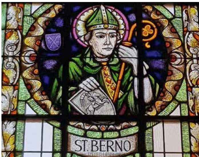
Porträt von Bischof Berno in der katholischen Propsteikirche St. Anna in Schwerin

Berno vereint drei wesentliche Punkte miteinander: Im Norden war sein Name zur