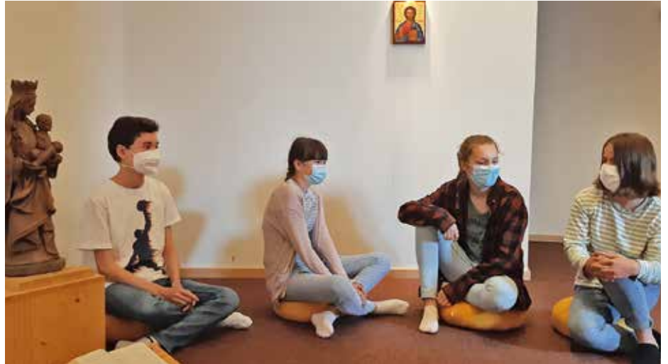
Morgenkreis im Raum der Stille.

Die erste Stunde am Montag ist in der Niels-Stensen-Schule traditionellerweise für die Gruppe reserviert: Die Klassenleiterstunden markieren – über das Übliche hinaus – von Klasse 5 bis 10 den Wochenstart. Die Themenpalette für Morgenkreis und Klassenleiterstunde ist groß. Immer wieder bereiten Schüler*innen auch selbst einen Wocheneinstieg vor. Einige 8. und 9. Klassen wählen dazu ein Thema aus Gesellschaft, Schule, Politik, Medien, kurz: aus allem, was ihnen unter den Nägeln brennt: von Fridays for Future bis Fair Trade, von Corona bis